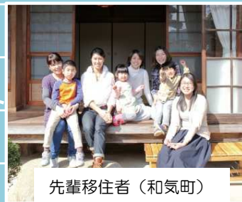
先輩移住者（和気町）

各市町の移住者支援団体や先輩移住者の方とざっくばらんにお話いただけます！ 知りたいこと、気になること、不安に思っていること、何でも遠慮なくお尋ねください。