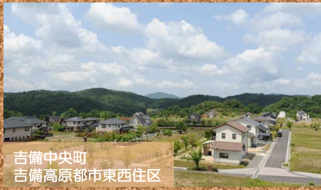
吉備中央町 吉備高原都市東西住区