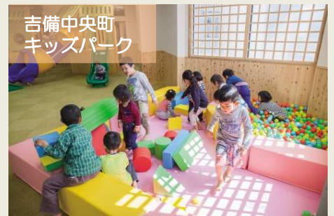
吉備中央町 キッズパーク