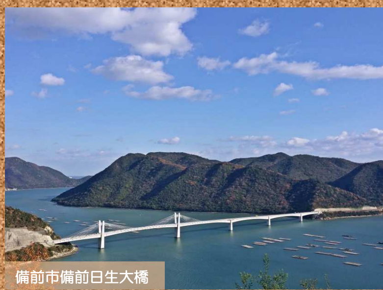
備前市備前日生大橋